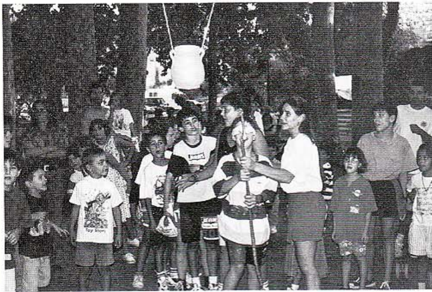
Joc de l'olla (tarda jove).